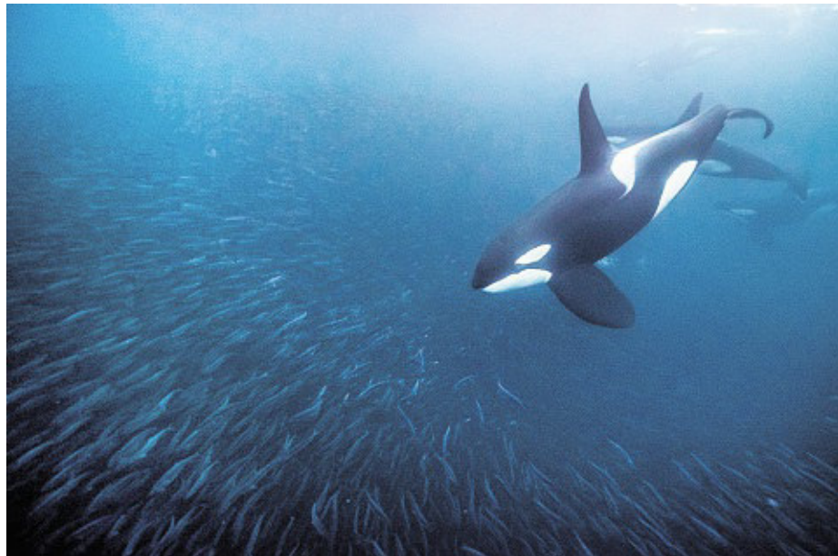
Mit seiner Kamera war der Fotograf bei der Heringsjagd der Schwertwale vor den norwegischen Vesterålen-Inseln live dabei.

Als es den gebürtigen Baden-Württemberger dann zum Meeresbiologie-Studium nach Kiel zog, wurden die Unterwasser-Expeditionen zunehmend professioneller und wissenschaftlicher: Proben entnehmen, Algen sammeln, Messungen vornehmen, Versunkenes wieder ans Tageslicht bringen. Das Fotografieren kam erst später dazu. Aus dem Hobby neben dem Studium ist inzwischen ein Beruf geworden: Uli Kunz fotografiert für namhafte Magazine wie „National Geographic“ oder „Geo“ sowie zahlreiche Fachbücher. Mit seiner 2013 gegründeten Tauchfirma „Submaris“ ist er außerdem weiterhin mit vier Freunden im Auftrag der Wissenschaft unter Wasser unterwegs.