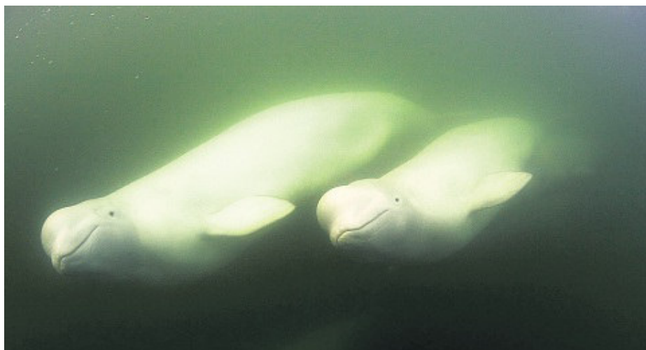
Die Beluga-Wale werden auch als die Kanarienvögel der Meere bezeichnet. Ihr Unterwasser-Pfeifkonzert gehört zu den wohl ungewöhnlichsten Geräuschen beim Tauchen.

Karten für die Live-Reportage „Abenteuer unter dem Meer: Expedition in die Welt der Wale, Haie und Robben“ am Freitag, 21. Oktober, gibt es an der Abendkasse zum Preis von 12 Euro. Eine Reservierung unter Tel. 04630/550 ist möglich. Die Veranstaltung beginnt um 19 Uhr in der Akademie Sankelmark, Akademieweg 6, 24988 Oeversee. Der Vortrag ist zugleich Auftakt der Tagung „Mythos Wal: König der Meere, Ernährer der Küsten und Stoff für Legenden“, die vom 21. bis 23. Oktober im Akademiezentrum stattfindet.