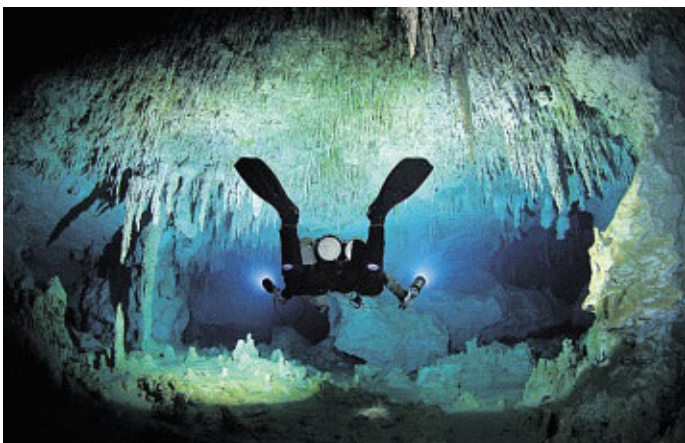
Mit den riesigen Stalagmiten und Stalaktiten ist diese Höhle vor Mexiko ein richtiges Unterwasserlabyrinth.