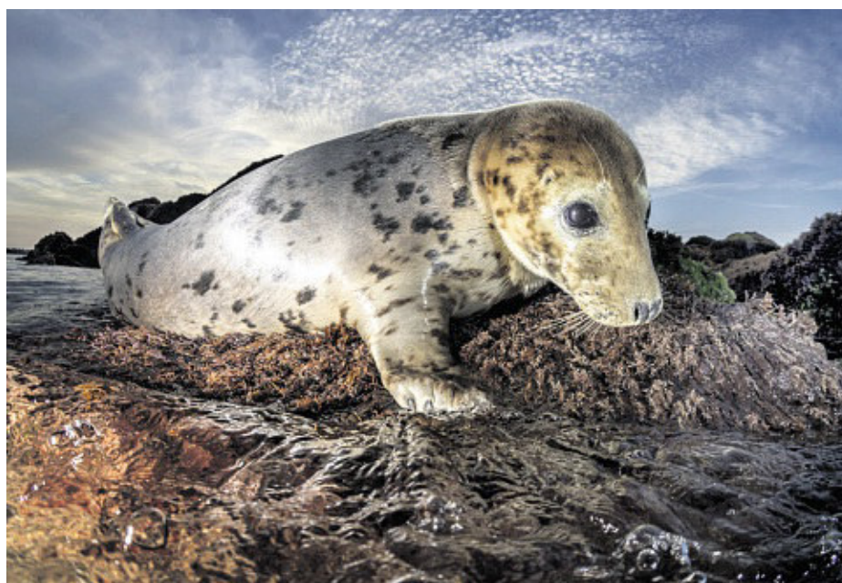
Die neugierigen Keigelobben vor Helgoland gehören zu Kunz' Lieblingsmotiven.

Doch es sind längst nicht nur die exotischen Orte, die den Kieler Fotografen faszinieren. „Auch in den heimischen Meeren gibt es viel zu entdecken“, findet er. >>>