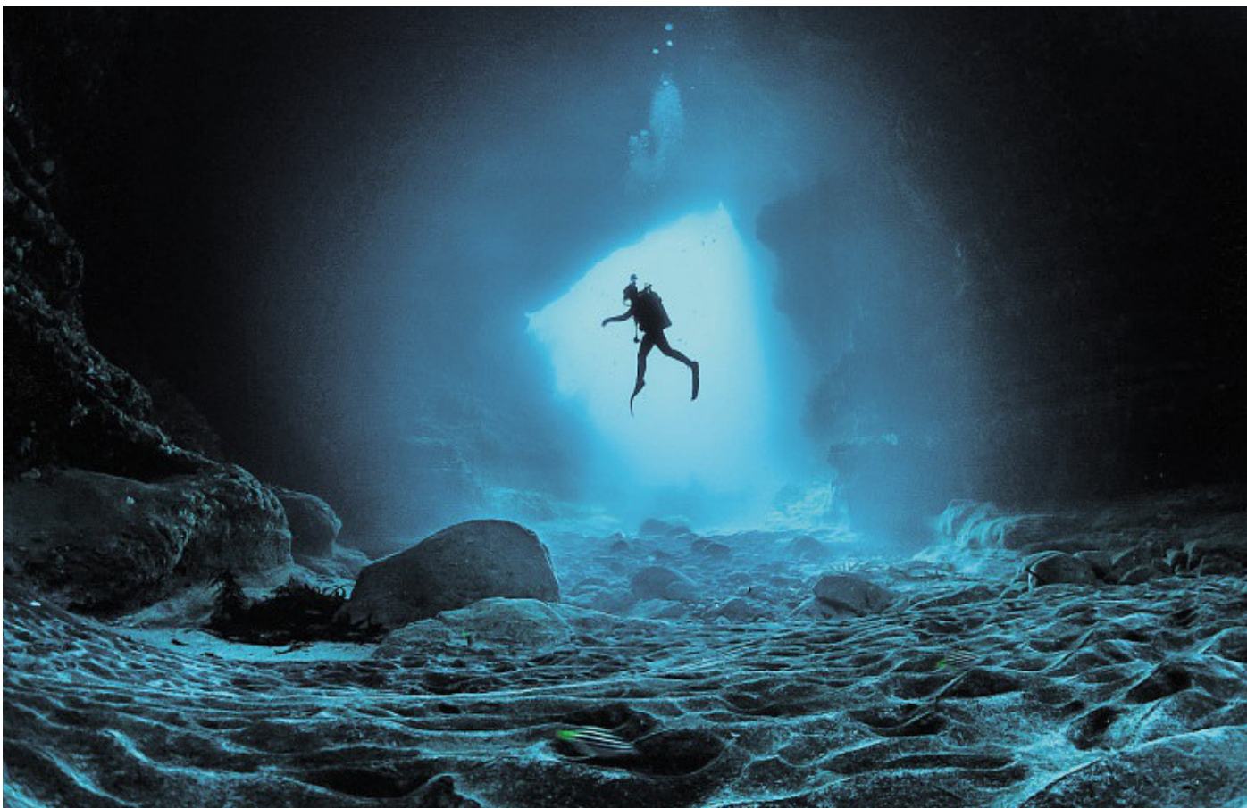
Mit einer Unterwasserexpedition in Tasmanien hat sich der Fotograf einen Traum erfüllt. Auch dort entdeckte er beeindruckende Höhlen.