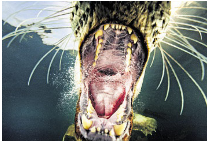
Die Kegelrobben sind so neugierig, dass sie sich auch mal ins aufgesperrte Maul fotografieren lassen.